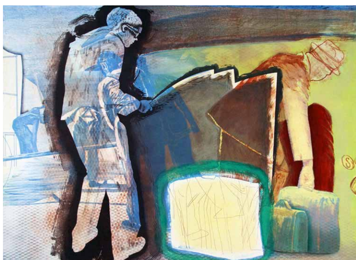
Wim Jonkman Binnen haparend handbereik, 125 x 95 cm, steendruk,