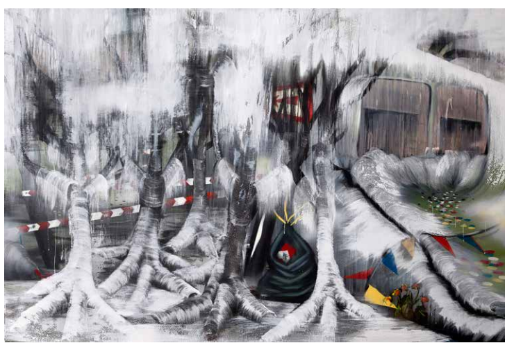
Joachim Nieuwhof Zonder titel, 184 x 270 cm, 2013 olie, acryl, spuitverf op doek