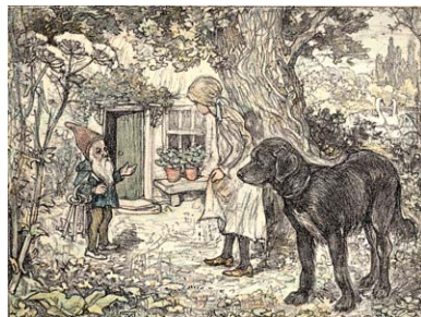
Illustratie uit 'Ella in het Feeënrijk' (1902)

In 1907 stelde hij zijn werk voor het eerst tentoon in het gebouw van het Kunstlievend Genootschap Pictura. Een eeuw later is hij terug in Pictura met een breed overzicht van zijn oeuvre uit de familiecollectie.