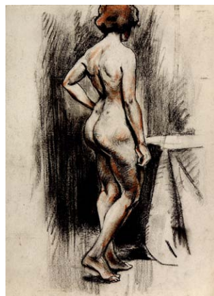
Naaktstudie ca 1890, houtskool met rood krijt. Pulchri portfolio

KOMENDE EXPOSITIE : vanaf 24 oktober - Kring van Nederlandse Tekenaars