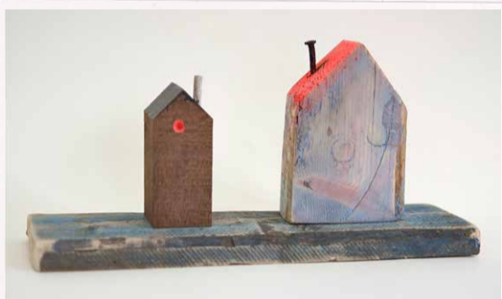
Harm Jan Boven Huis