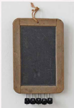
Flip Drukker iHype