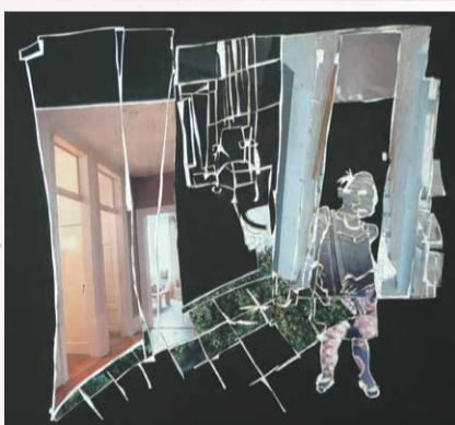
Hinnie Steenbruggen Interieur III