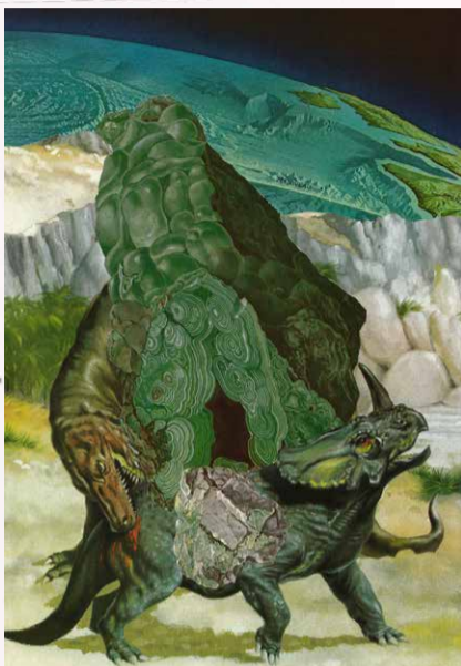
Eduard Bezembinder Malachite dinos 1800