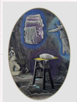
Wim Jonkman Somnambule, pkw 40